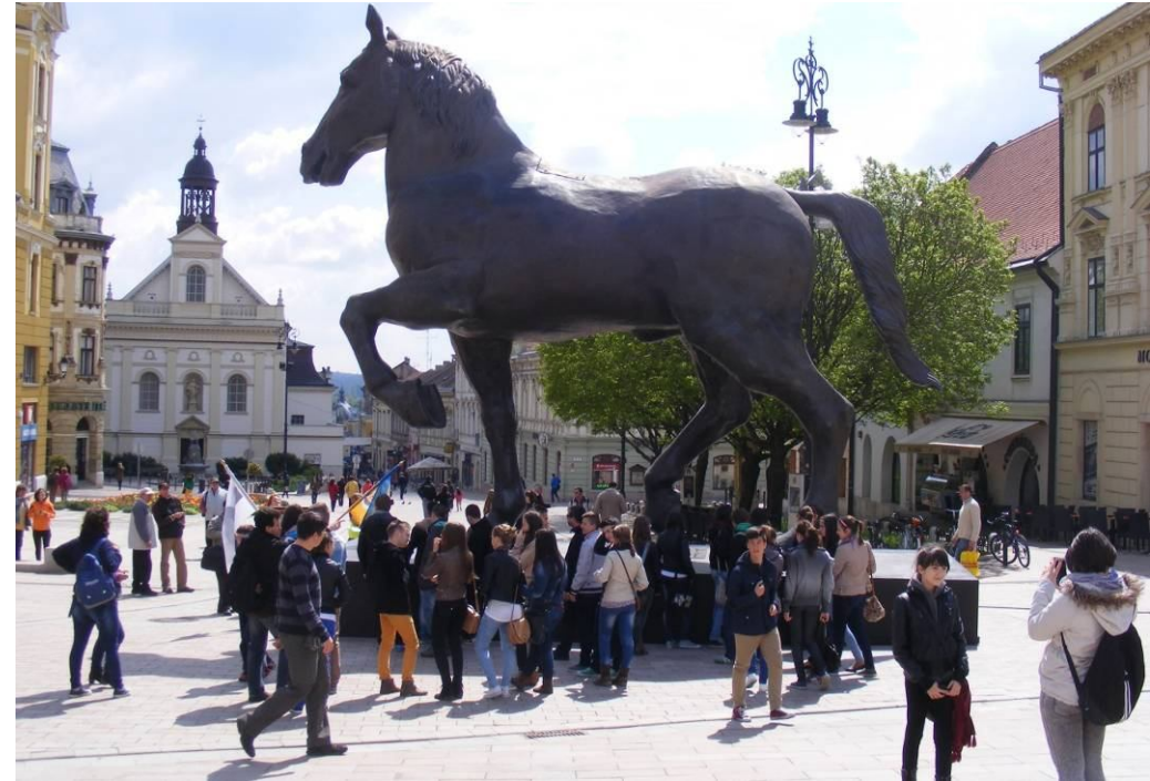
A pécsi belváros pazar építészeti emlékekkel szolgál.